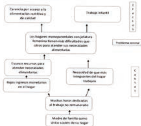
Árbol del problema público que atiende el programa Mujeres Líderes del Hogar

En el árbol del problema, se identificó como una de las principales causas, los escasos recursos económicos, considerando que en Jalisco de acuerdo con el CONEVAL 4 , la población vulnerable por ingresos aumentó al pasar de 8.3% en 2018 a 9.8% en 2020.